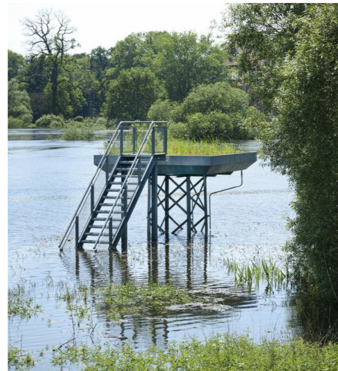
Skulpturenpark in der Seegeniederung, Bob Bräse: »Der hohe Sumpf von Gartow, 2007«